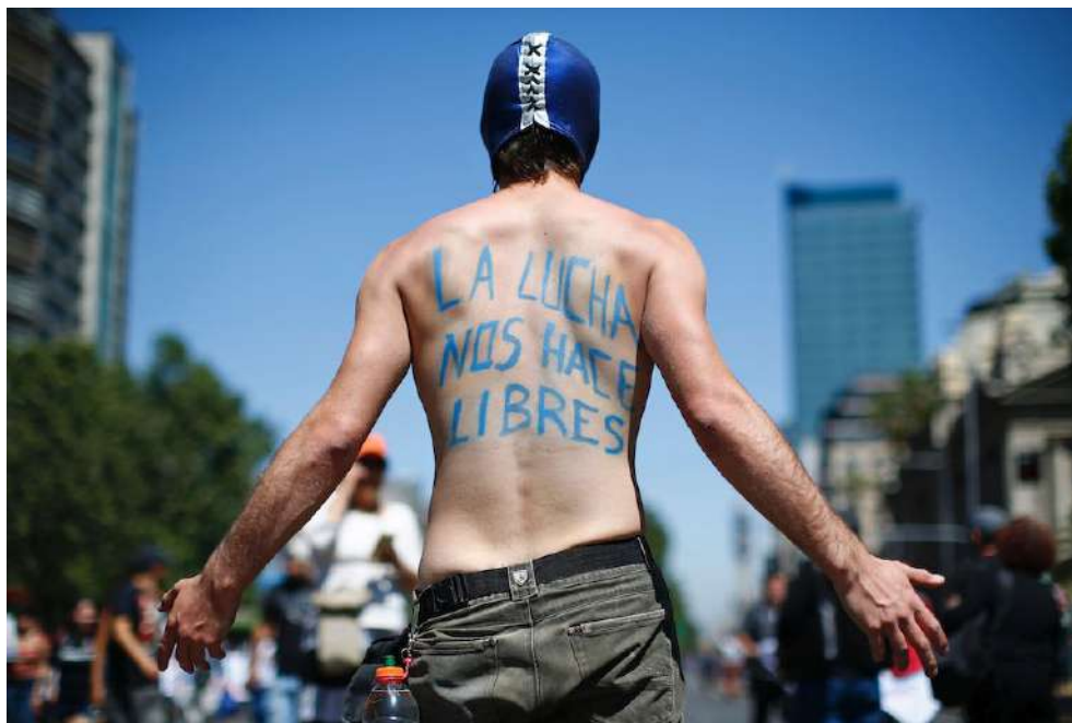
La lotta ci rende liberi

In questi giorni i collegi dei docenti di tutte le scuole sono chiamati ad attuare l'ultima controriforma scolastica proposta dal ministro Valditara, ministro dell'istruzione ma soprattutto del merito. Si tratta della riforma dell'orientamento, uno degli obiettivi previsti a livello europeo dal PNRR.