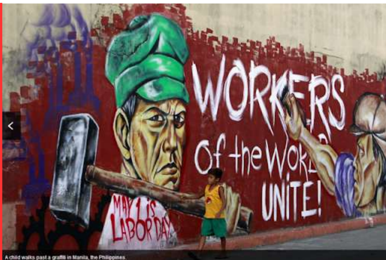
A child walks past a graffiti in Manila, the Philippines.

Materiali di intervento dei comunisti anarchici per la lotta di classe