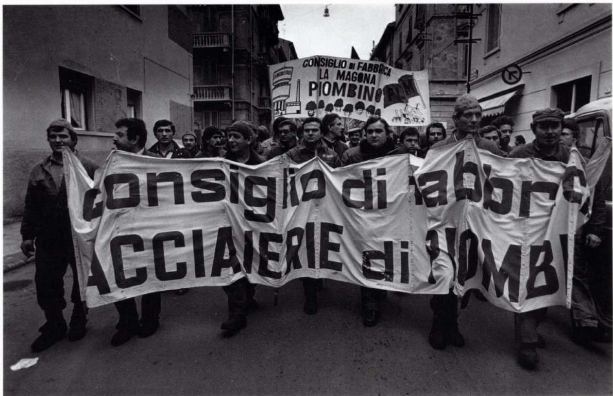
PIOMBINO FEBBRAIO 1983

Nella Flm si incontrano strategie come quella del sindacato di pro-