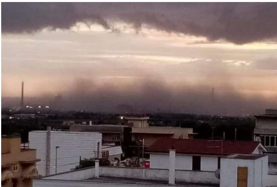
Giornata di vento a Taranto. Foto scattata il 7 febbraio 2022

La produzione nell'impianto siderurgico Ilva di Taranto ha compromesso la salute dei cittadini e violato i diritti umani per decenni, provocando un grave inquinamento atmosferico. I residenti che vivono nelle vicinanze dell'impianto "soffrono di malattie respiratorie, cardiache, cancro, disturbi neurologici e mortalità prematura". Lo scrive il Relatore speciale delle Nazioni Unite sugli obblighi in materia di diritti umani relativi al godimento di un ambiente sicuro, pulito e sostenibile, David R. Boyd, d'intesa con il Relatore speciale Marcos Orellana sulle implicazioni per i diritti umani della gestione e lo smaltimento di sostanze e rifiuti pericolosi, nel rapporto annuale intitolato "The right to a clean, healthy and sustainable environment: non-toxic environment". Il rapporto è stato pubblicato e approvato dal Consiglio per i