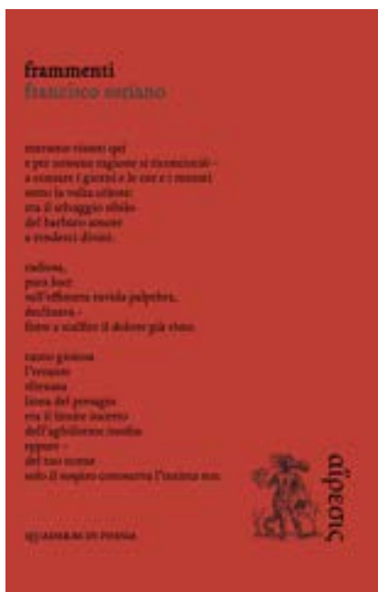
Francisco Soriano, frammenti , Eretica Edizioni, 2022.