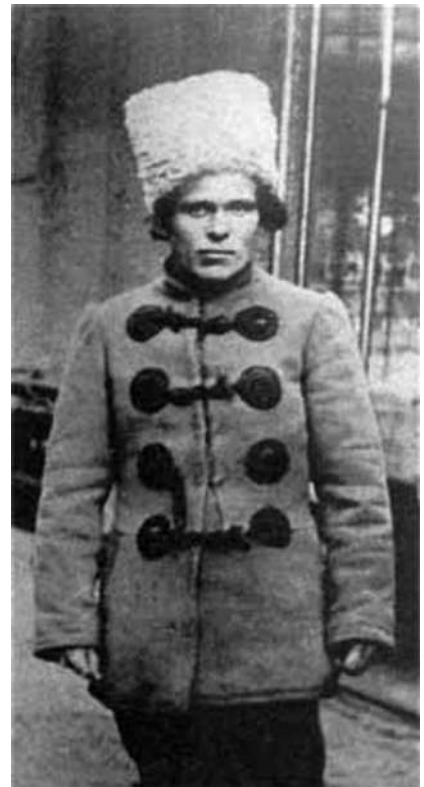
Nestor Ivanovič Makhno Huljajpole 1888 – Parigi 1934

I tempi in cui vive attualmente la classe lavoratrice in tutto il mondo impongono agli anarchici rivoluzionari la massima tensione di pensiero e la massima energia per chiarire le questioni più importanti. Ogni compagno deve essere cosciente di questa esigenza, farne oggetto delle sue riflessioni ed arrivare alla conclusione che solo tramite una forza organizzativa unita possono gli anarchici identificare ed analizzare rapidamente le questioni che preoccupano le masse ed ispirarle con successo. Quei nostri compagni che hanno svolto un ruolo attivo nella rivoluzione russa e che sono rimasti fedeli alle proprie convinzioni si saranno resi conto dei danni che l'assenza di una solida organizzazione