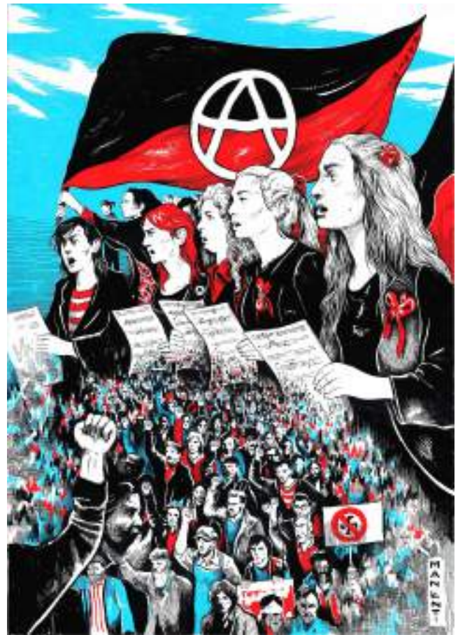
Fischia il vento, eppur bisogna andar